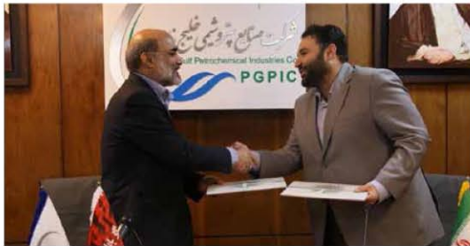
مدیرعامل شرکت گاز استان البرز با اشاره به تنوع و فراوانی نیروها با کارهای و پرداختی‌های متفاوت، بعنوان یکی از مشکلات صنعت نفتی و پررونق انرژی و اصلاح مقررات آژندهای نیروی انسانی در این شرکت و در بخش‌های مختلف به منظور تسهیل خدمات تأکید کرد.

همایش‌های سلامت روان طراحی شده است تا بستری برای آموزش و فرهنگ‌سازی لازم شود تا خانواده‌ها به شریعی که با آن روبرو هستند، آگاهی بیشتری پیدا کنند. ابوشاره به محور همایش‌های آینده داد: تا پایان اسفند ماه همایش‌های دیگری با محورهای همچون روان‌شناختی و دوره تخصصی کودکان، اعتیاد به فضای مجازی و آسیب‌های آن برگزار خواهد شد. رئیس نظارت و ارزیابی مرکز خدمات مشاوره‌ای صنعت نفت تأکید کرد: بعد از ارائه مشاوره به کارکنان رسمی است که در ۱۳۹۶ نوبت سربازی شده و با مراجعه به مراکز طرف قرارداد شرکت نفت، خدمات آنها استفاده کنند. ارائه خدمات مشاوره‌ای رایگان به کارکنان غیررسمی، امکان ثالث و قراردادی فعالیت دیگر این مرکز است. همچنین همسو با ارائه این خدمات، برگزاری سلسله