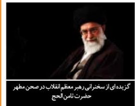
گزیده‌ای از سخنرانی رهبر معظم انقلاب در صحن مطهر حضرت ناین الحج