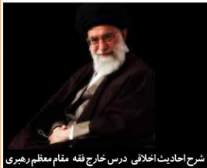
شرح احادیث اخلاقی درس خرافه حقیق مقام معظم رهبری