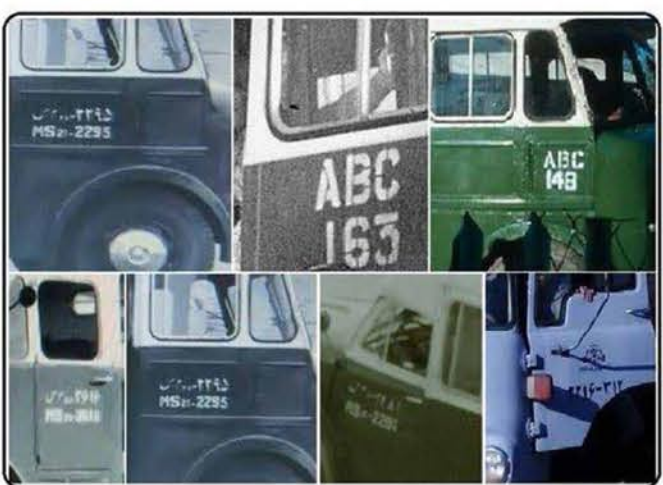
مخفف اسامی مناطق مختلف نفتخیز و یا کد مربوطه بر روی خودروهای شرکت نفت

(Masjed-I-Suleiman) است. همین طور واژه ام ای ان «M.I.N» که مخفف «Maidan-I-Naftoon» است.