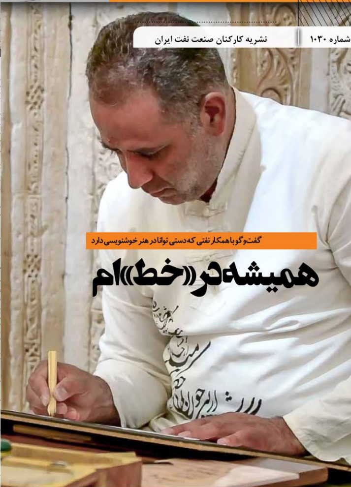
گفت‌وگو با همکار نفتی که دستی نوآباد هنر خوشنویسی دارد