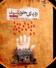
رد پای خورشید

کتاب «رد پای خورشید» نوشته کوشنده‌ای خوش ذوق به نام مهدی محمدنی است که سال‌هاست آثار مذهبی و آیینی او در قالب داستان‌های کوتاه و بلند، خوانندگان زیادی دارد. «رد پای خورشید» سرگذشت نامه حضرت نابغه‌الله (الحسین) (ع) است و نویسنده در ابتدا وسایع و در عین حال جذاب، مهدی‌زانی توان نایب‌گردد گرفت. بعد کتاب خواننده، مطالعه «رد پای خورشید» را شروع کند و نخواهد آن را به پایان برساند. در مقدمه این کتاب آمده است: «آنچه تاریکی‌ها را می‌زداید، نور است و روشنائی است؛ خورشید منبع عظیم این روشنائی است که پس از تابان‌تر شدن و به‌همه چیز همه‌کس قابلیت دیدن‌ش می‌دهد، نور و روشنائی است؛ خورشید منبع عظیم این روشنائی است که پس از تابان‌تر شدن، سایه‌ها باطل‌و نوبخش خود، صبحی سید را به‌هستی هدیه می‌کند. این همان حس (ع) خورشید عالم‌تاب است که در روزگار سایه برود، درخشند اما دوسر نان خواسته‌ند، خیال خام خود، جلوی روشنائی او را بگیرند. خورشید را سر بر بندند، پر تیره گردند؛ غافل از آنکه خورشید هر چه بالا رفت، بر تو پر فروغ آن از کوجه پس کوجه‌های کوفه گذشت و شام و حجاز و سپس دنیا را روشن کرد.»